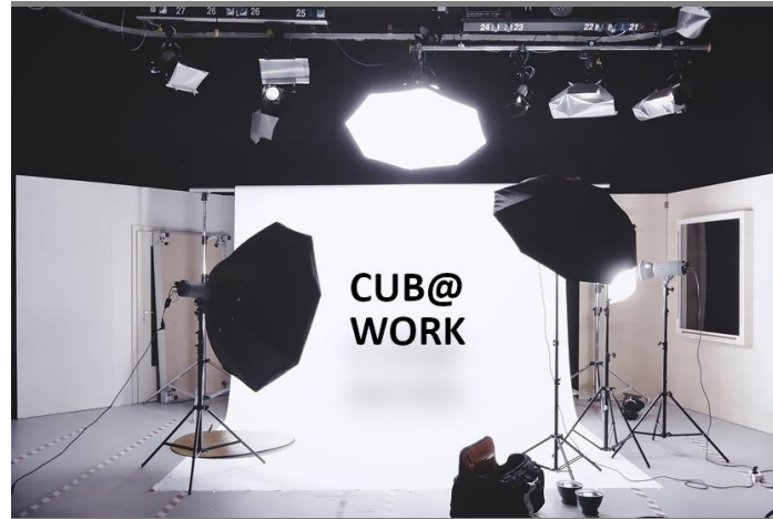
Video poświęcone studium przypadków

5 października 2021 partnerzy zaangażowani w projekt CUB@Work spotkali się we włoski Turynie, w celu omówienia postępów w projekcie. Dzięki spotkaniu twarzą w twarz (pierwszym od początku projektu!) spotkanie było wyjątkowo udane. Tematem przewodni spotkania było omówienie narzędzi uwrażliwiania na nieświadomione uprzedzenia kulturowe oraz materiały szkoleniowe.