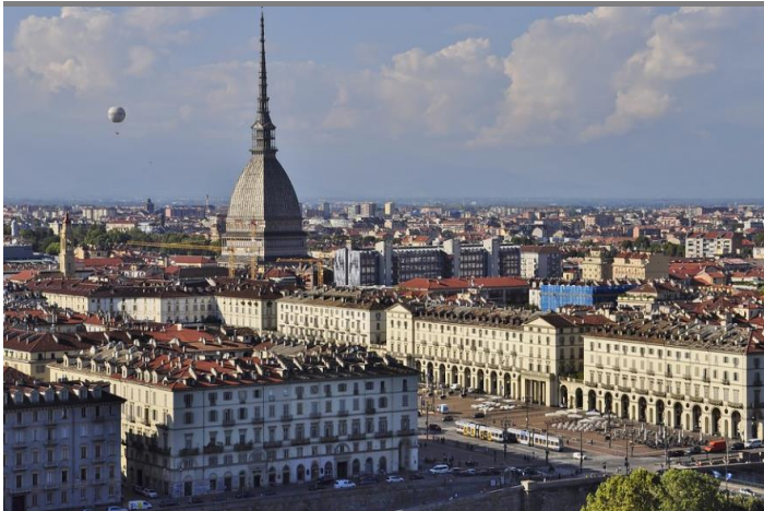
Spotkanie w Turynie

5 października 2021 partnerzy zaangażowani w projekt CUB@Work spotkali się we włoski Turynie, w celu omówienia postępów w projekcie. Dzięki spotkaniu twarzą w twarz (pierwszym od początku projektu!) spotkanie było wyjątkowo udane. Tematem przewodni spotkania było omówienie narzędzi uwrażliwiania na nieświadomione uprzedzenia kulturowe oraz materiały szkoleniowe.