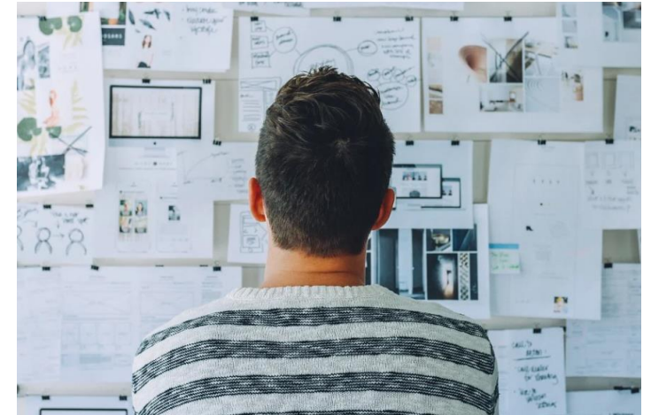
Wnioski z projektu

Do końca roku partnerzy będą zajęci produkcją materiałów do pakietu szkoleniowego. Kurs składać się będzie z 4 modułów na temat uprzedzeń kulturowych w sektorze MŚP. Praca nad modułami zaczęła się od rozplanowania struktury każdego z nich. Bieżące sprawdzanie zapewni wysoką jakość materiałów, które na końcu zostaną przetłumaczone na języki narodowe.