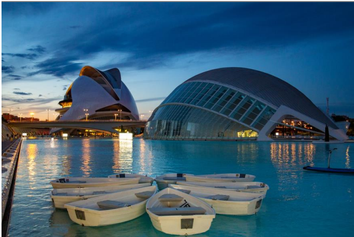
Spotkanie w Valencji

Czwarte spotkanie odbędzie się w Walencji (Hiszpania) w kwietniu 2022. Będzie to kolejna okazja żeby przedyskutować bieżące rezultaty działań w ramach projektu, Intellectual Output 2, materiały szkoleniowe jak również kolejne kroki w projekcie