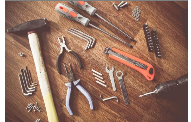
Más elementos del kit de herramientas

Un elemento importante de la caja de herramientas de sensibilización sobre el sesgo inconsciente son los vídeos de estudios de casos basados en situaciones de la vida real. Los socios trabajaron en ellos durante el primer año del proyecto y los llevaron a buen término. Los casos de vídeo presentan ocho situaciones en las que se produce un sesgo cultural inconsciente en las PYME y analizan estrategias para superar el sesgo.