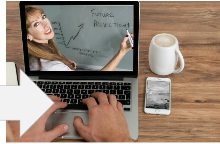
CUB@Work curso formativo online

El curso en línea, implementado como Recurso Educativo Abierto, incluye 4 módulos de formación sobre el sesgo cultural inconsciente con el objetivo de mejorar las competencias clave de los empresarios y el personal de contratación de las PYME.