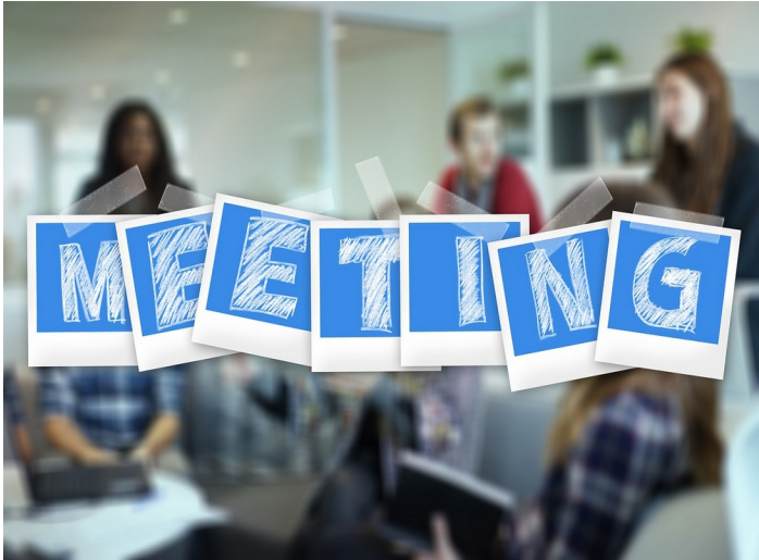
Project Kick-off meeting

Nell'ottobre 2020 si è tenuto online il Kick-off meeting del progetto. Il team ha discusso il piano del progetto e gli output intellettuali. Tutti i partner si sono concentrati sulla prima attività - gli studi di casi video.