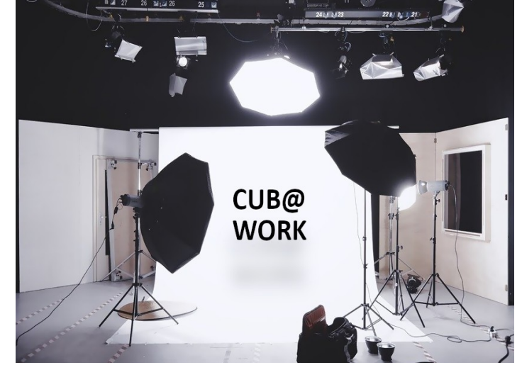
Piano di lavoro per casi di studio e video

Durante gli incontri di gennaio e marzo sono stati presentati i primi risultati. Il progetto ha ottenuto la sua identità visiva e ulteriori attività sono state divise tra i partner del progetto.