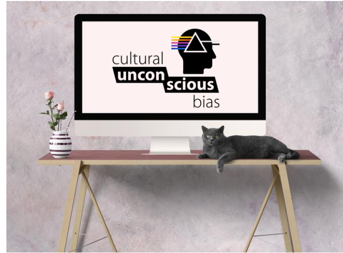
Detaillierte Besprechungen der intellektuellen Ergebnisse

Im Oktober 2020 fand das Kick-off-Meeting des Projekts online statt. Das Team diskutierte den Projektplan und die intellektuellen Ergebnisse. Alle Partner konzentrierten sich auf die erste Aktivität - die Video-Fallstudien.